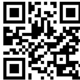
财务管理专业 ACCA 班申请表